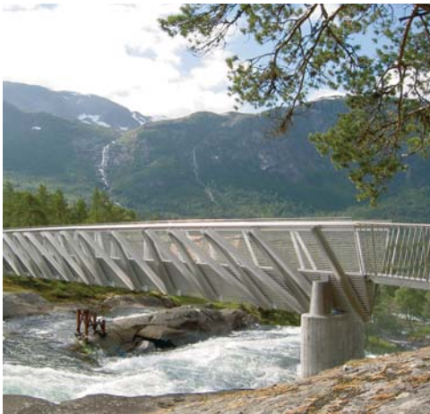
Fussgängerbrücke Gaularfjäll, Norwegen

LDX 2101® ist ein von OUTOKUMPU neu entwickelter korrosionsbeständiger Duplex-Stahl mit tiefem Nickelgehalt. Wie alle Duplex-Stähle weist LDX 2101® eine hohe Festigkeit und Zähigkeit auf, was auf ein ausgewogenes ferritisch-austenitisches Mischgefüge zurückzuführen ist. Die Korrosionsbeständigkeit von LDX 2101® ist derjenigen der meisten rostfreien Standardstähle ebenbürtig. Die Kombination dieser Eigenschaften erlaubt es daher verschiedenste Anwendungen bezüglich Festigkeit, Korrosionsbeständigkeit, Unterhalt, Langlebigkeit und Kosteneffizienz zu optimieren.